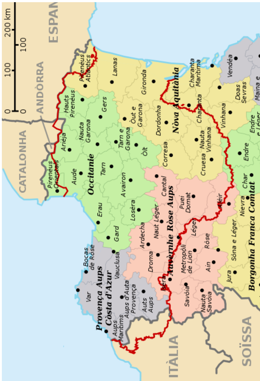
Mapa: Joan Francés Blanc