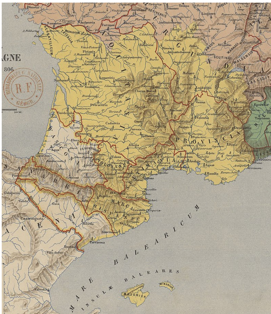
Mapa: Auguste Longnon